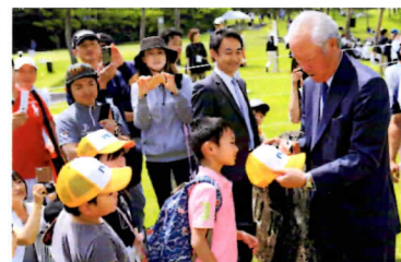
青木功プロのサイン会