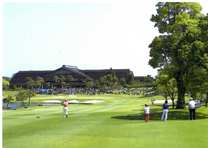
18番セカンドショット

KYORAKU MORE SURPRISE CUP 2016 Photo gallery