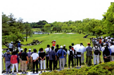
9番ティイングランド